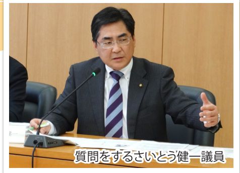
質問をずるさいとう健一議員

【答弁の要旨】路線バス会社と上尾市には、要請のお話を考えて参ります。個別の輸送手段については、費用対効果も含めて検討して参ります。